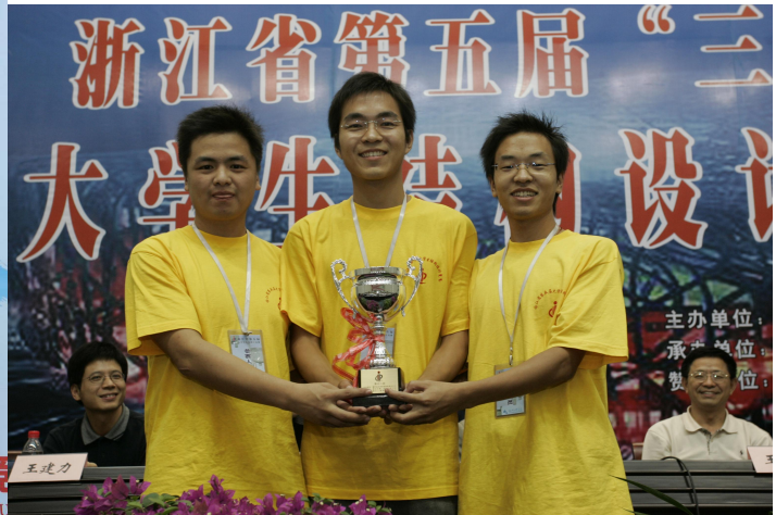
浙江省第五届大学生结构设计竞赛特等奖

依托产业集群，注重校企联动。绍兴市是全国第一建筑大市，拥有1000多家建筑企业，60多家勘察设计企业、40多家监理企业，建筑业总产值占全市GDP的21.8%。本专业以产业优势为导向，先后与华汇工程设计集团、绍兴市市政设计院、浙江联合建工设计院、浙江省有色金属地质勘查局、浙江省工程勘察院、宝业集团、中成建工集团、长业建设集团、环宇建设集团、中厦建设集团、上海家树建筑工程有限公司等20余家单位建立校外教学科研实习基地，聘请50多位企业领导和技术专家担任校外导师，联合培养应用型人才。